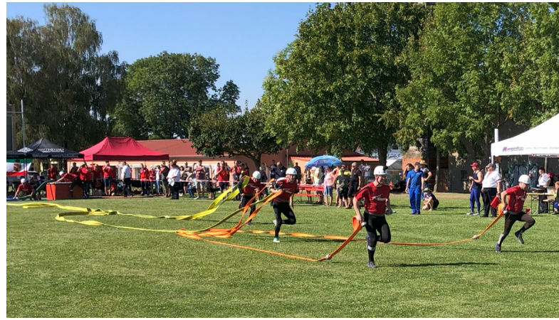
Die Feuerwehr Zella absolviert ihren Löschangriff nass bei den Landesmeisterschaften in Tüttleben

Im Jahr 2023 fanden überdies die 40. und 41.