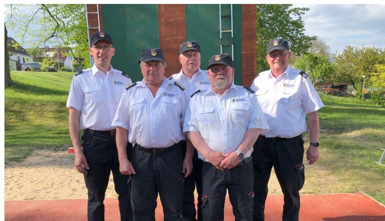
Wertungsrichter, die als Kampfrichter bei einer Fortbildung des Deutschlandpokal in Mecklenburg-Vorpommern eingesetzt wurden