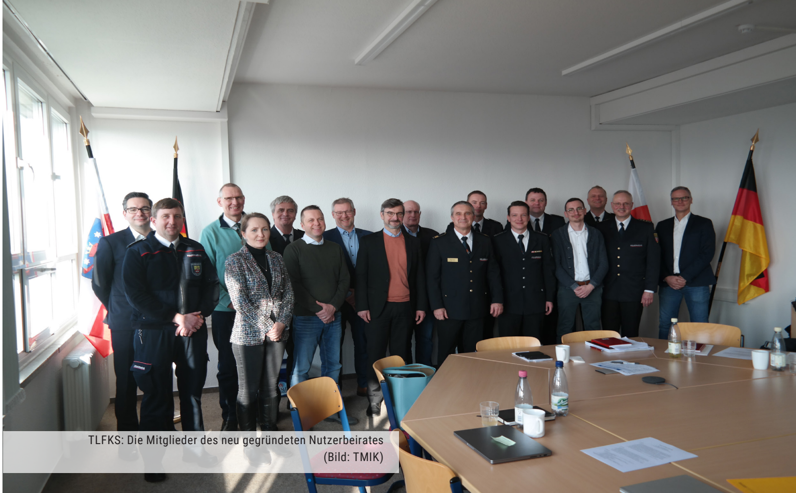
TLFKS: Die Mitglieder des neu gegründeten Nutzerbeirates