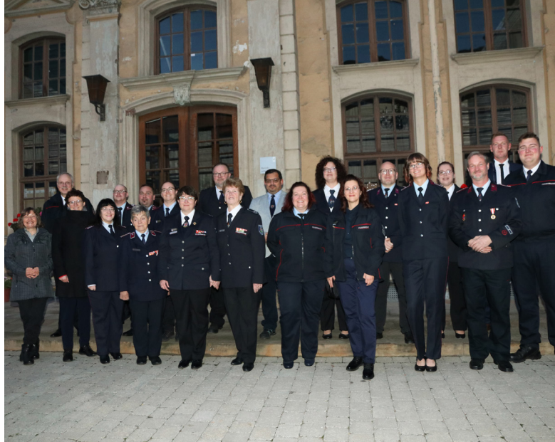
Ehrungsveranstaltung für die Berater und Beraterinnen des EMVü-Projektes in Erfurt