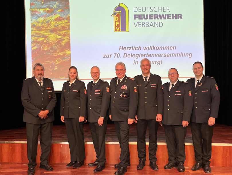
Delegiertenversammlung des Deutschen Feuerwehrverbandes in Coburg

Bezüglich geplanter Mittelkürzungen wird seitens des Deutschen Feuerwehrverbandes und der Landesfeuerwehrverbände gefordert, diese zu revidieren. Eine ausreichende Finanzierung des Zivil- und Katastrophenschutzes ist in Zeiten großer Flächenbrände und internationaler Krisen wie dem Ukrainekrieg unerlässlich, um sicherzustellen, dass die zukünftigen Anforderungen erfolgreich von den Beteiligten bewältigt werden können.