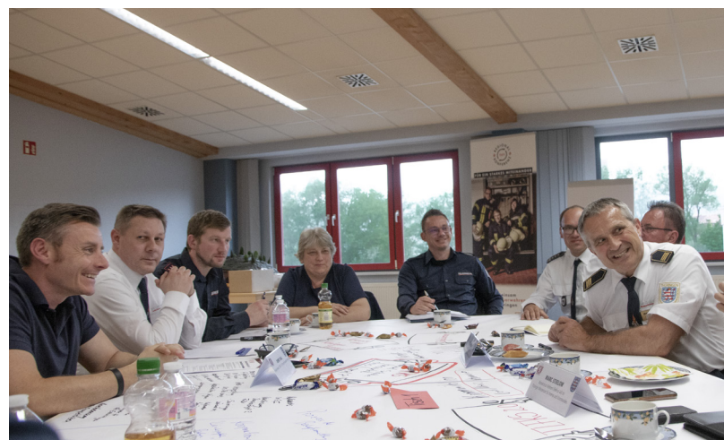
Regionalkonferenz in Zella-Mehlis: Austausch über die anstehenden Vorhaben an der TLFKS

Die große Bandbreite der behandelten Themen und die praxisbezogene Entwicklung von Strategien, wie mit der Problematik „Gewalt gegen Einsatzkräfte“ umzugehen ist, fand unter den Teilnehmenden großen Zuspruch. Am Ende der Workshops kamen alle Referenten in einem gemeinsamen „Blitzlicht“ zu Wort um die jeweilige Grundaussage ihrer behandelten Materie prägnant zusammenzufassen. Es lässt sich festhalten, dass das Thema für die teilnehmenden Feuerwehrleute und die