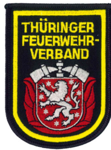
Abb. 3 – Ärmelabzeichen Thüringer Feuerwehr- Verband