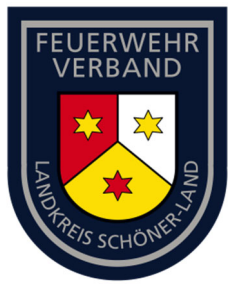
Abb. 2 – Muster Ärmelabzeichen Kreis- und Stadtfeuerwehrver-